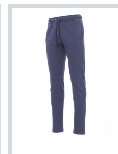
LIGHT DENIM MELANGE