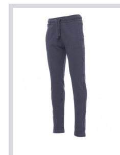
BLU DENIM MELANGE