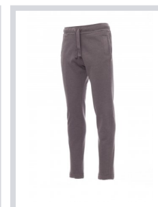
STEEL GREY MELANGE