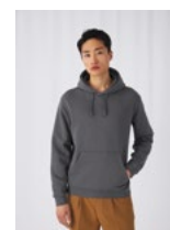
ESISTE IN UNISEX. B&C HOODED